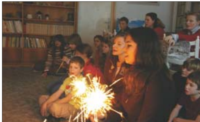
Vánoční nálada prostoupila celým domovem