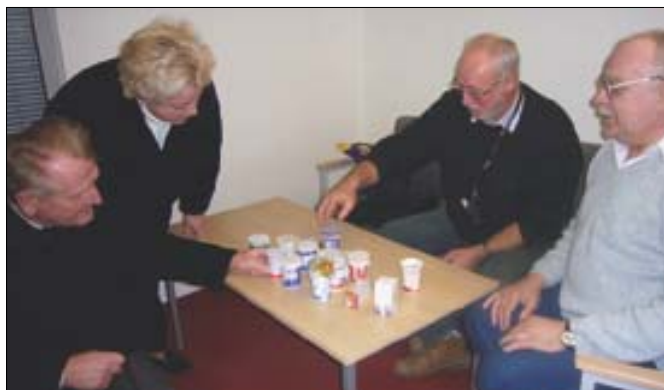
Zdravotní referent ZO při přebírce vzorků zimní měli.