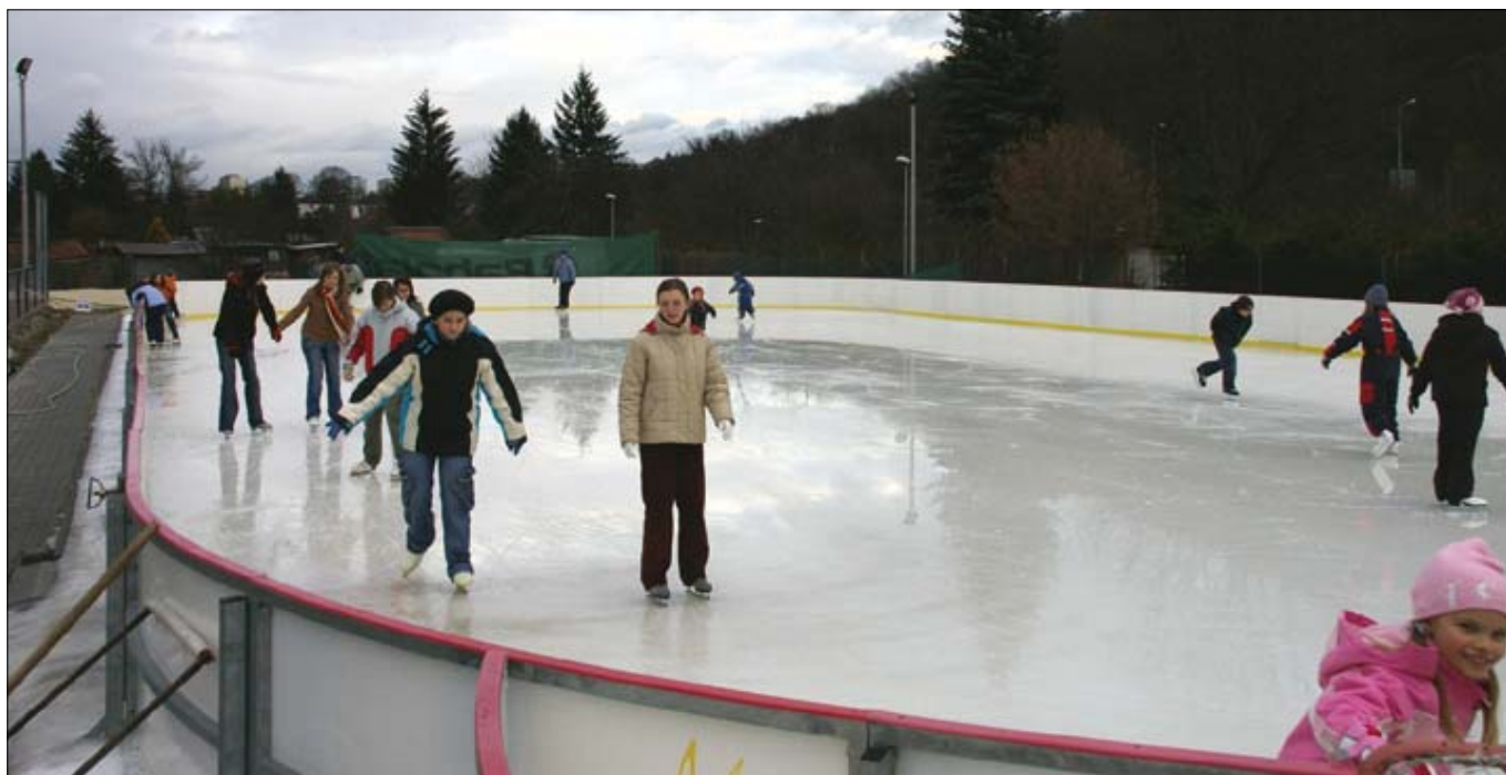
Mobilní ledová plocha je k dispozici dětem i dospělým.

Z OBSAHU: JAK NA NOVÝ ROK... • HEJTMAN A STAROSTA OCENILI DĚTI • ZPRÁVY Z RADY A ZASTUPITELSTVA MČŽ • STALO SE V ŽABOVŘESKÁCH • PLES ZASTUPITELSTVA MČŽ • ROZPOČET MČŽ NA ROK 2007 • KOMUNÁLNÍ ODPAD • NABÍDKA NA PRÁZDNINY • DESATERO K BEZPEČÍ • KD RUBÍN • SPORT • INZERCE •