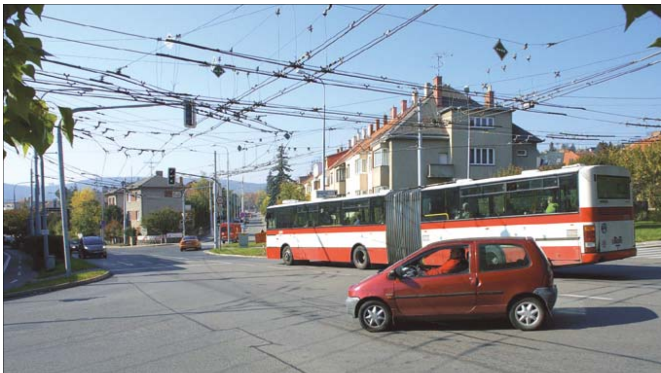
Křižovatka Královopolská-Přívrat s pohledem do Kroftovy ulice zatížené autobusovou dopravou

Z OBSAHU: VÁŽENÍ SPOLUOBČANÉ, SOUSEDÉ • DALŠÍ 100. NAROZENINY V ŽABOVŘESKÁCH! • ZPRÁVY Z RADY A ZASTUPITELSTVA MČŽ • UŽÍVÁNÍ OBEČNÍCH BYTŮ • ZE ŽIVOTA ŽABOVŘESKÝCH ŠKOL • POBOČKA KNIHOVNY JIŘÍHO MAHENA PŘIPOJENA • Z GALERIE ŽABOVŘESKÝCH OSOBNOSTÍ • KD RUBÍN • INZERCE