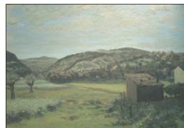
František Foltýn, Žabovřesky 1950-52 olej, plátno, 90 x 120 cm

Moravská galerie v Brně připravila na zimní měsíce letošního roku rozsáhlou retrospektivní výstavu Františka Foltýna (1891–1976), jednoho z nejvýznamnějších malířů spjatých s Brnem. Foltýnovy obrazy mají své místo ve většině dlouhodobých expozic českých muzeí umění. Součástí rozsáhlého projektu, kterému předcházely více než dva roky příprav, je nejen velká výstava, ale i obsáhlá publikace s vůbec prvním soupisem Foltýnova díla.