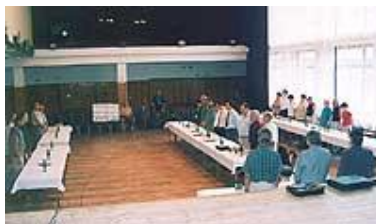
Dva notoricky známé spoluobčany minuta ticha ze židli nezvedla ...

Toto gesto Stalinových pohrobků vnímám jako pohrdání a pocit nadřazené beztrestnosti ke všem zavražděným, umučeným a okradeným spoluobčanům v letech, kdy komunisté této zemi vládli. Tento projev arogance je nutno brát v úvahu zvláště ve srovnání s projevy současným představitelů KSČM, kteří se snaží zlehčovat a distancovat se od projevů bezpráví, které komunisté napáchali, a odmítají jakékoliv srovnání s fašismem. Dlužno říci, že mají asi pravdu ve druhé části předchozí věty, protože komunismus má na svědomí daleko více obětí než fašismus, a jak se vidět, snaha o nastolení komunistické diktatury nevymizela z hlav komunistů dodnes.