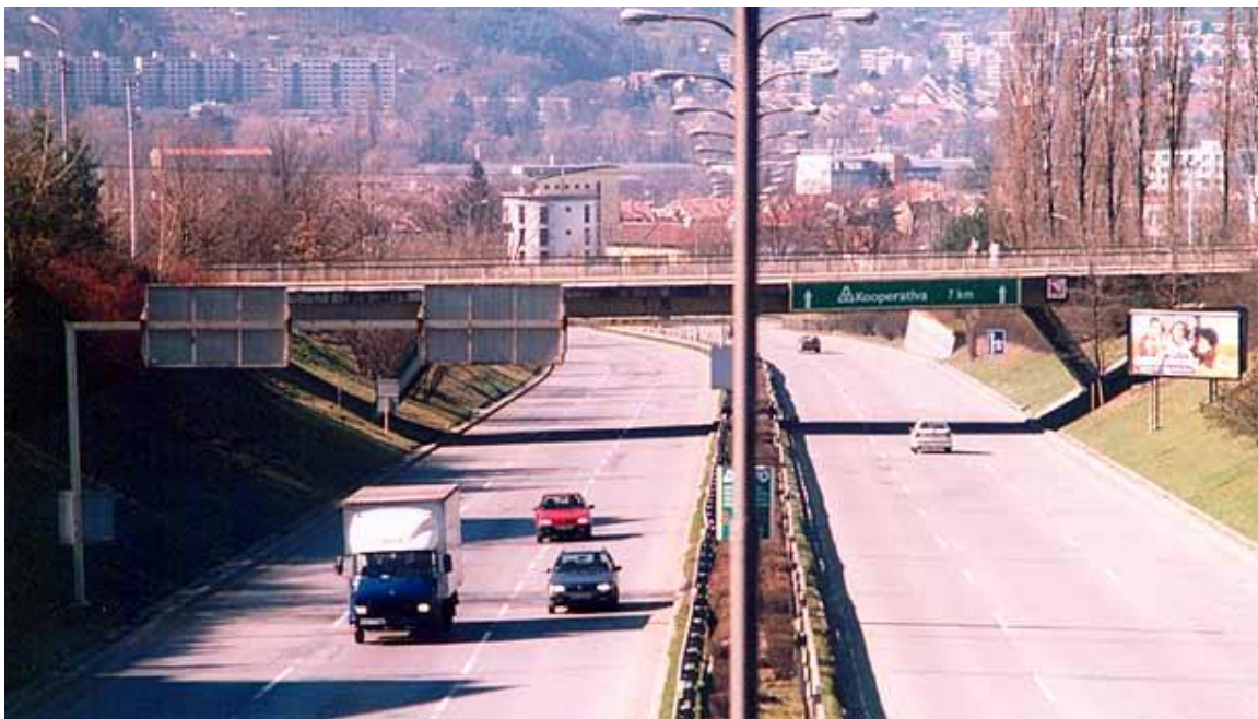
Velký městský okruh je i velkým tématem dneška.