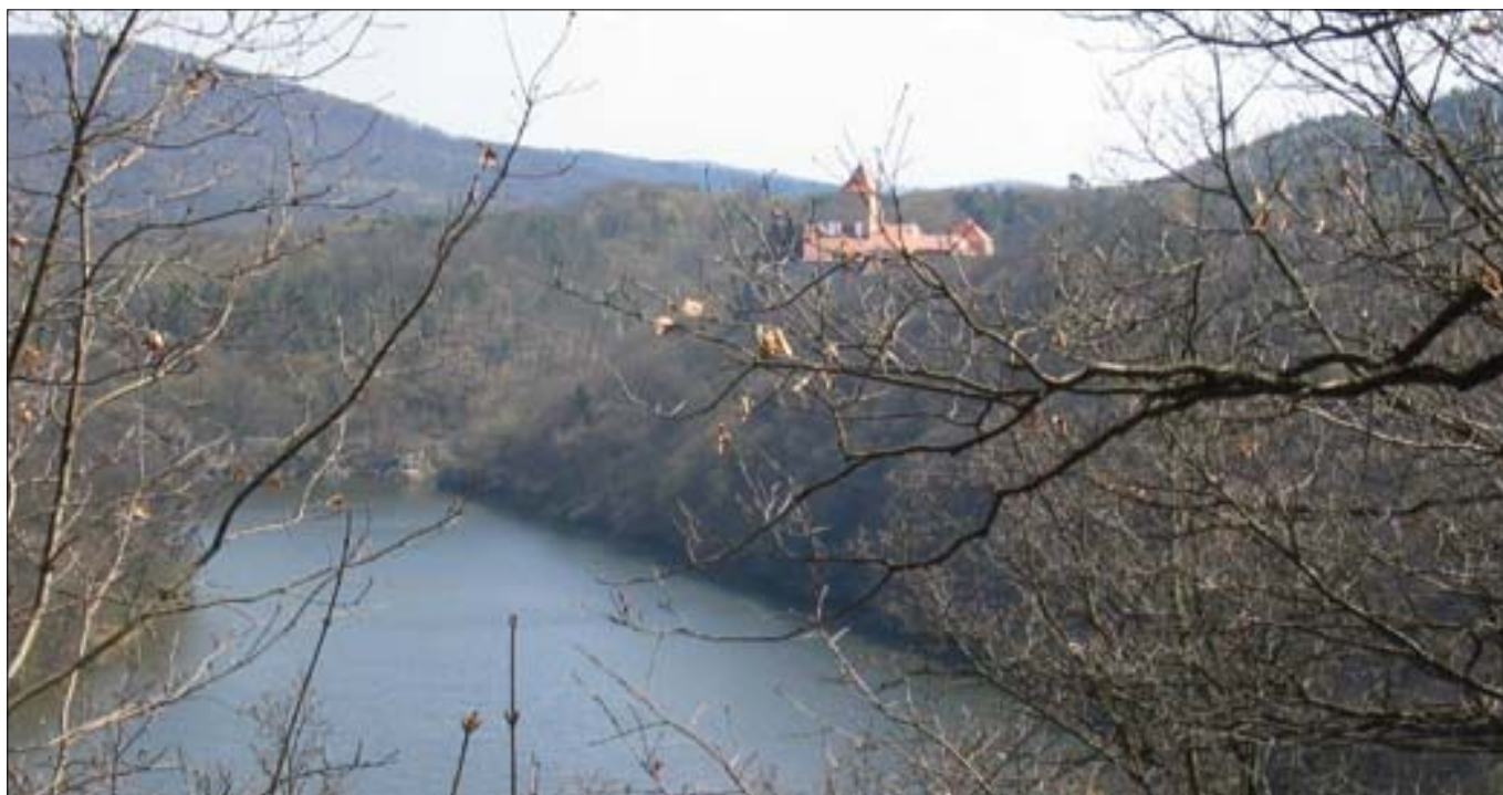
Hrad Veverí - začátek území, o kterém je řeč