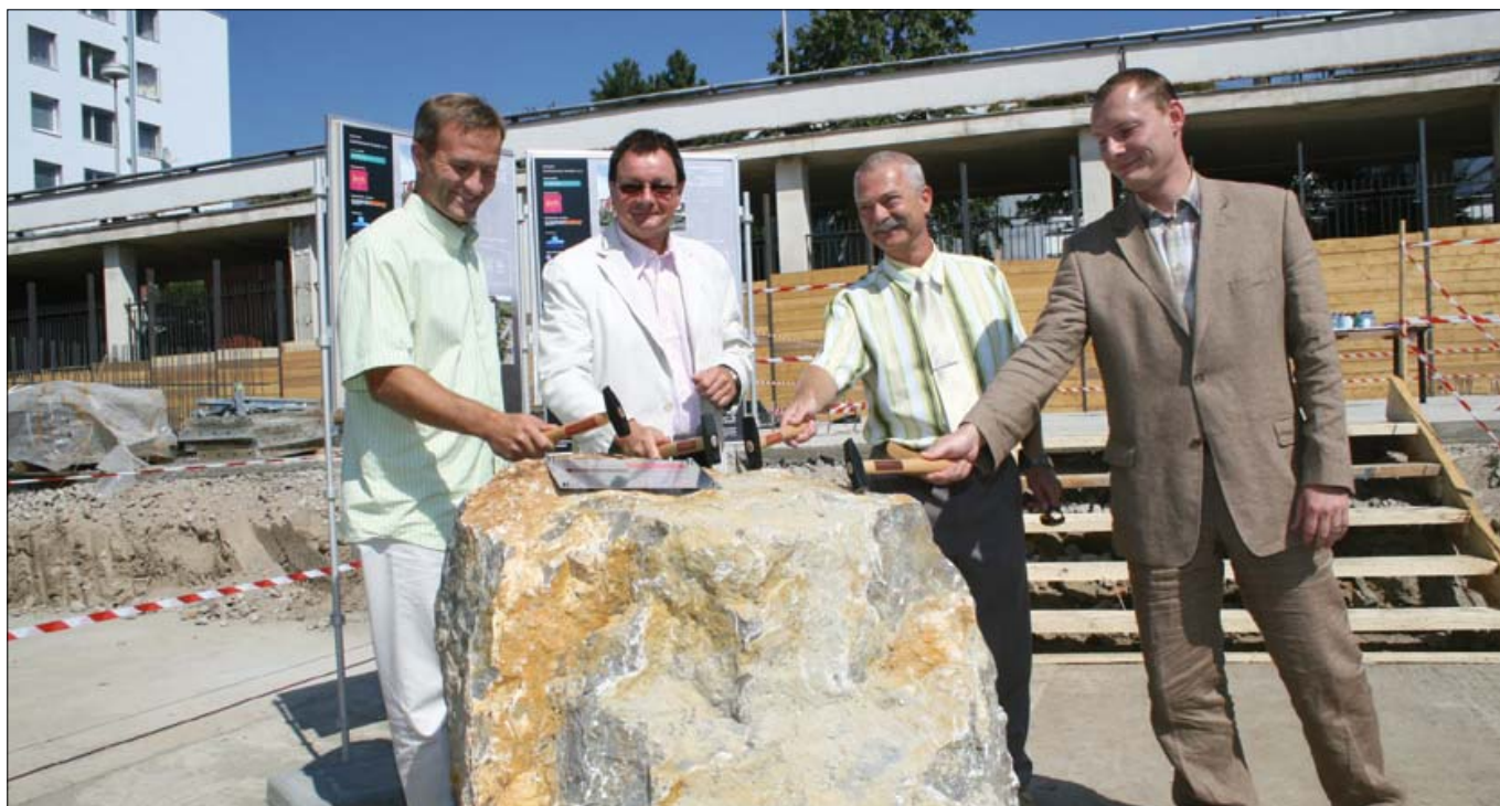
Poklepem základního kamene polyfunkční budovy byl zahájen proces změn v lokalitě ulic Sochorovy a Podveské.

Z OBSAHU: NEJKRÁSNEJŠÍ POHÁDKY JSOU TY, KTERÉ PÍŠE SÁM ŽIVOT • ZPRÁVY Z RADY A ZASTUPITELSTVA MČŽ • DEN CHARITY • POLICIE INFORMUJE • ZÁPIS DO KROUŽKŮ • BRNĚNSKÉ DNY PRO ZDRAVÍ • ZŠ SIROTKOVA • NEBEZPEČNÝ DUCHOVNÍ? • KD RUBÍN • SPORT V ŽABOVŘESKÁCH • INZERCE •