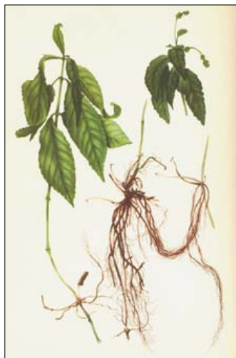
ING. GUSTAV ZÁVODSKÝ, CSc

Praktické využití rostlina zatím nemá. Svou nenápadností je rostlina chráněna před vyrýváním a přenášením do zahrádek. Rovněž pro farmaceutické využití jejích alkaloidů se dosud nenašlo medicínské použití.