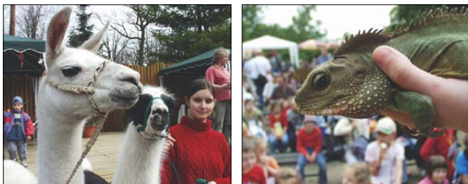
Při akcích pro veřejnost vystupují i různá kontaktní zvířata, například lamy či agamy